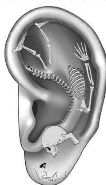
C. Inverted Somatotopic Body on Auricle