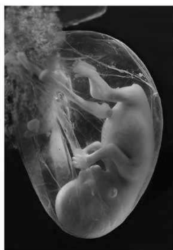
B. Inverted Fetus in Uterus