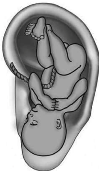
A. Inverted Fetus Pattern on Auricle